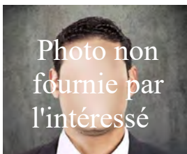
Photo non fournie par l'intéressé